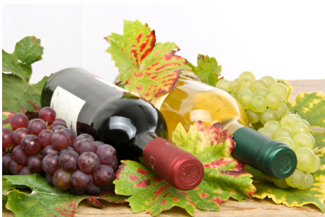
Thematisch: Weine aus dem heimischen Anbaubereich, präsentiert von erfahrenen Winzern

Ausführliche Informationen online unter www.forum-gesundheitsakademie.de