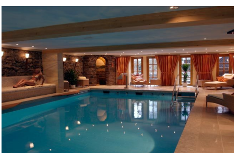
Entspannen und erholen Sie sich in der hoteleigenen Wellnesslandschaft

Entdecken Sie die Vielfalt der Weinkultur des Mittelrheins bei unserem exklusiven Abendprogramm inklusive Weinverkostung. Lassen Sie sich kulinarisch verwöhnen mit einem deliziösen 4-Gänge-Menü.