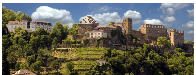
Im wunderschönen Loreleytal am Rhein gelegen.